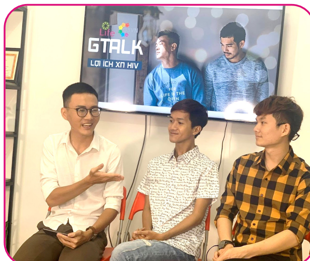
Nâng cao nhận thức