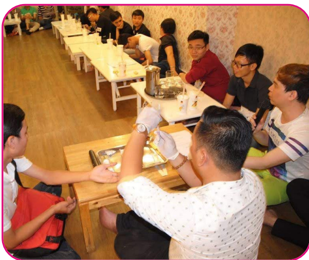
Nâng cao năng lực